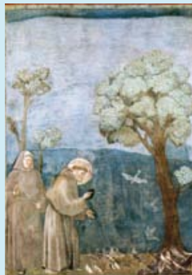
Assisi, Basilica di San Francesco, La "Predica agli uccelli" di Giotto