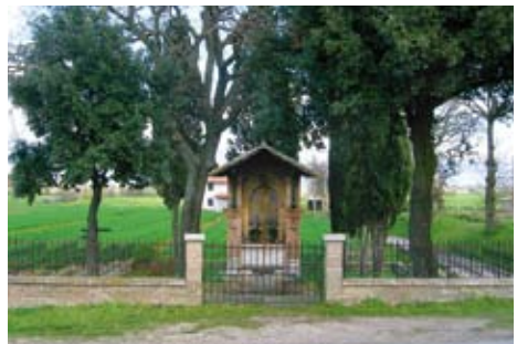
L’Edicola di Piandarca, oggi

”L’episodio della Predica agli uccelli (cfr. 1 Cel. 38; 3 Cel. 20) notissimo attraverso la versione datane dai Fioretti, cap. XVI (nel medesimo contesto), e da Giotto (Basilica superiore di Assisi)... avvenne tra Cannara e Bevagna, nel luogo detto Pian dell’Arca , secondo una tradizione viva anche oggi.