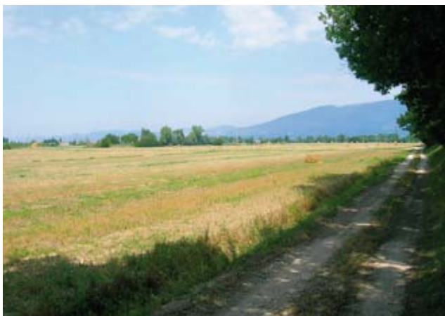
Cantalupo di Bevagna. Parte del sentiero percorso dal Leprohon in direzione del sito della “Predica” (in alto a sinistra). Sullo sfondo, seminascosta dagli alberi, Assisi.