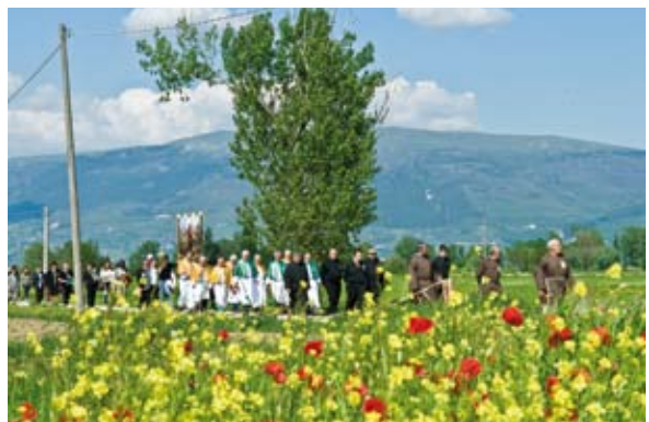
Il sentiero tra campi fioriti.