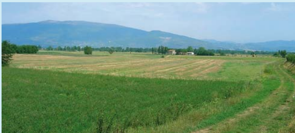
Piandarca della "Predica agli uccelli"