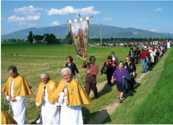
Processione a Piandarca. Panorama del sito della “Predica”. Sullo sfondo, il monte Subasio.

Piandarca non è un toponimo di recente formazione. Esso compare, sotto grafie diverse ( Planus Arche , Piandarcha, Piandarco, Pian d’Arca, Pian dell’Arca) in molti antichi documenti storici di Cannara, a partire almeno dal 1300. E’ una terra pianeggiante, non contaminata dalla mano dell’uomo, destinata all’agricoltura di pregio, inserita in un panorama delimitato a sud ovest dalle colline di Montefalco, di Bevagna e di Collemancio,