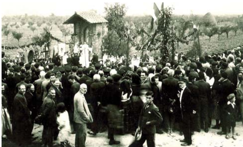
Piandarca di Cannara, anno 1926. Inaugurazione dell'Edicola a San Francesco

Essa ha seguito l'andamento delle vicende storiche e sociali, con periodi di maggiore e minore presenza di popolo: per quanto attiene alla nostra memoria, era stata sospesa negli anni Settanta- Ottanta, per poi essere