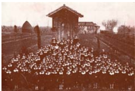
Piandarca, 1926 circa. Alunni e maestri della Scuola Elementare di Cannara in una foto ricordo davanti all'Edicola.

ripresa, con sempre maggiore interesse e partecipazione nell'ultimo ventennio.