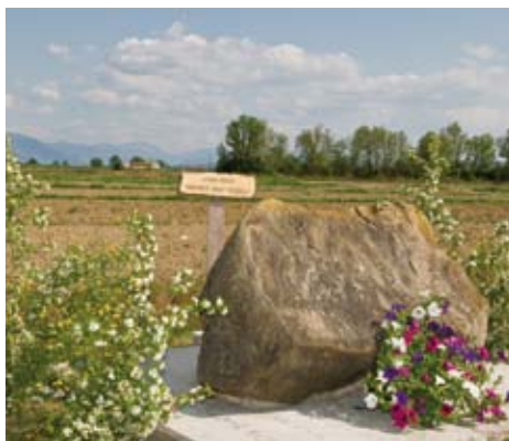
La pietra a ricordo della "Predica agli uccelli" (2004)